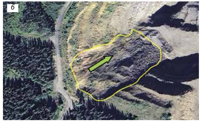
Рис. 1. Деформации бортов карьеров (на снимках из космоса): а – в массиве горных пород с низкими прочностными характеристиками; б – в массиве на контакте горных пород с различающимися прочностными характеристиками

Fig. 1. Deformations of open pit walls (as seen in satellite images): а – in rock masses with low strength properties; б – at the interface between rock masses with differing strength properties