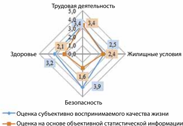
Группа индикаторов «Личное благосостояние»