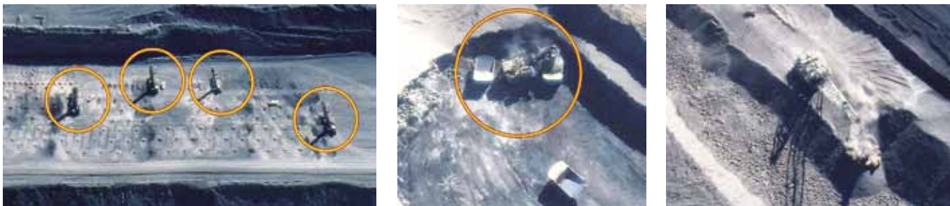
Рис. 2. Фрагменты горных работ в карьере Saraji на снимках из космоса: а – бурение взрывных скважин; б – выемка и погрузка вскрышных пород; в – перемещение вскрышных пород драглайном в выработанное пространство карьера Fig. 2. Fragments of mining operations in the Saraji open pit mine in the satellite images: а – drilling of blast holes; б – overburden excavation and loading; в – overburden transportation to the worked-out space of the open pit using a dragline