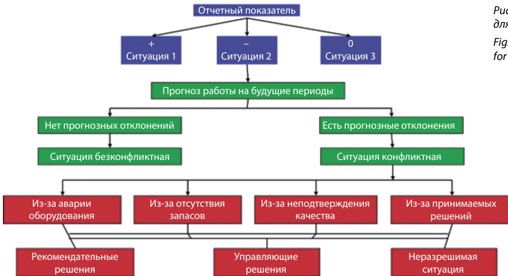
Рис. 1. Граф признаков и действий для одного типа показателя Fig. 1. A graph of features and actions for one type of indicators