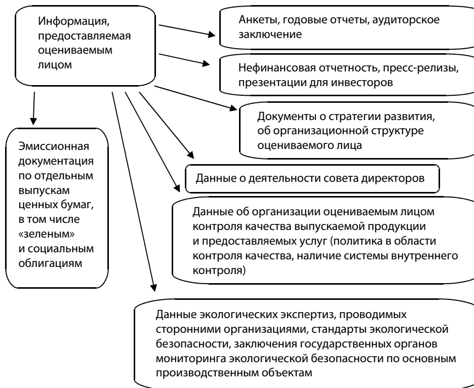
Рис. 1. Блок-схема проведения оценки, этап 1 Fig. 1. Block diagram of the evaluation process, Stage 1