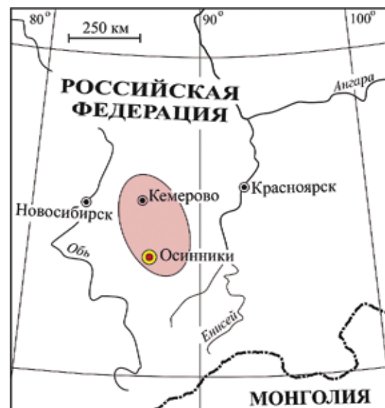
Рис. 1. Схема района исследований

Тем не менее изучение продуктов, возникших в процессе природного пирогенеза, до сих пор остается слабым звеном в познании эпигенетических изменений, происходящих в угленосных отложениях терриконов. Сведения о них имеют большое значение для понимания природы горения горных пород, в том числе и для прогнозной оценки степени экологической опасности терриконов для окружающей среды и населения угледобывающих регионов. Цель настоящей работы – изучить основные продукты пирогенеза угленосных отложений терриконов и выявить особенности их состава и строения.