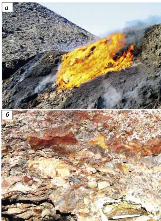
Рис. 2. Открытый тип пирогенеза на терриконе (а), который способствует пирометаморфизму обломков пород и превращению их в спекшиеся красноцветные пирогенные (керамические) образования (б)