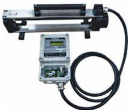
Рис. 3. Анализатор пыли СДП-1 Fig. 3. The SDP-1 Dust Analyzer

Прибор СДП предназначен для непрерывного измерения оптической плотности и вычисления массовой концентрации пыли в атмосфере рабочих зон, горных выработок, вентиляционных систем угольных и промышленных предприятий [14].