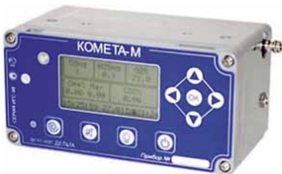
Рис. 2. Газоанализатор Комета-М Fig. 2. The Kometa-M Gas Analyzer

При мониторинге пылегазового облака, прежде всего, необходимо использовать не только газоанализатор как основной прибор контроля выброса вредных веществ в атмосферу, но и оптические датчики пыли, например прибор СДП-1, показанный на рис. 3.