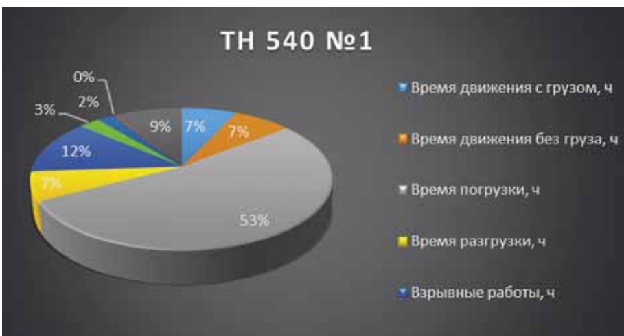
Рис. 3. Загрузка ШАС № 1, вариант «как будет»