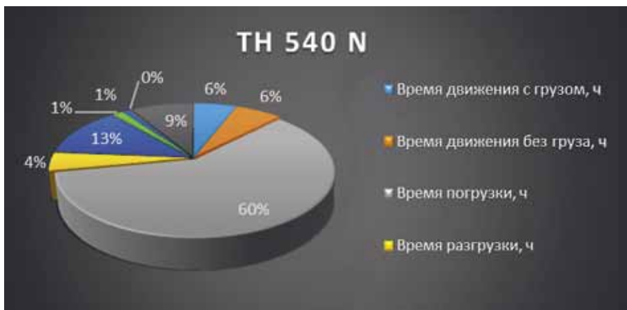
Рис. 4. Загрузка ШАС № 2, вариант «как будет»