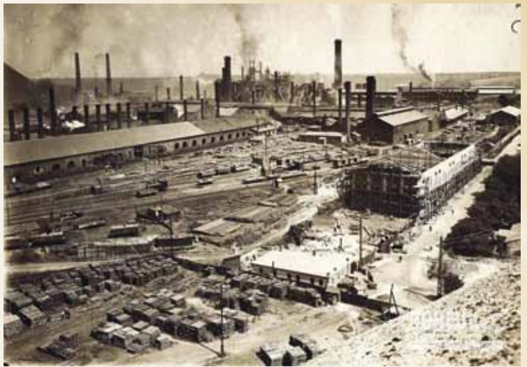
Юзовка до революции

Донбасс продолжал наращивать угольное производство и в послереволюционные 1920-1930 годы прошлого столетия, когда экономика СССР была вынуждена развиваться ударными темпами – Стране Советов были нужны промышленные ресурсы и вы-