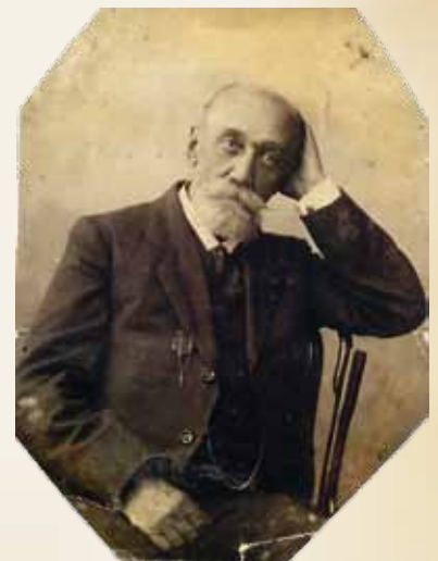
Горлов Николай Петрович (1774 – 1849)

С развитием в России промышленного производства, а также началом строительства железных дорог, в середине XIX века интерес к донецкому углю значительно возрос. Дальнейшее развитие Донбасса связано с именем российского горного инженера Петра Николаевича Горлова, который в 1871 г. заложил мощную капитальную шахту – «Корсунская копь» (современная шахта «Кочегарка»). По техническому оснащению шахта стала одной из лучших в Донбассе, а возникший около