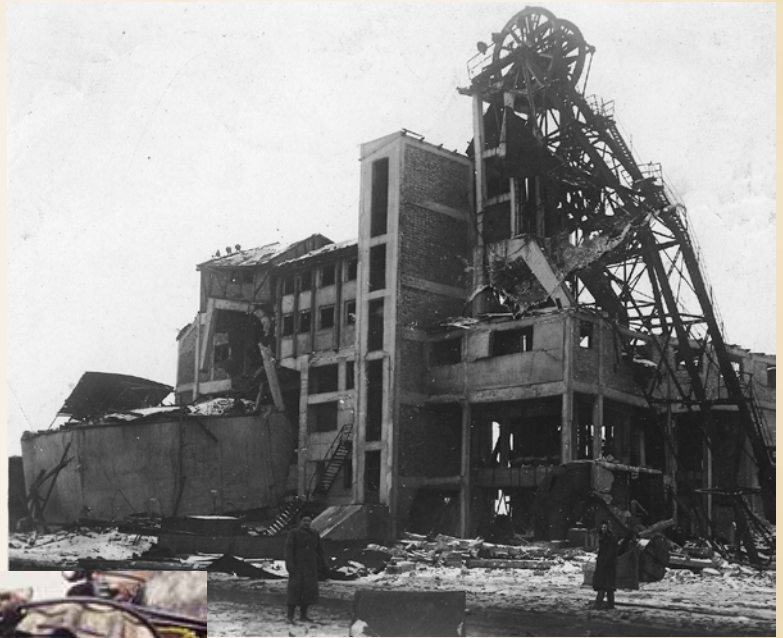
Шахты Донбасса, 1943 г.