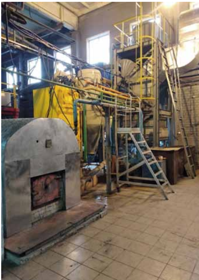
Рис. 2. Участок сжигания топлива